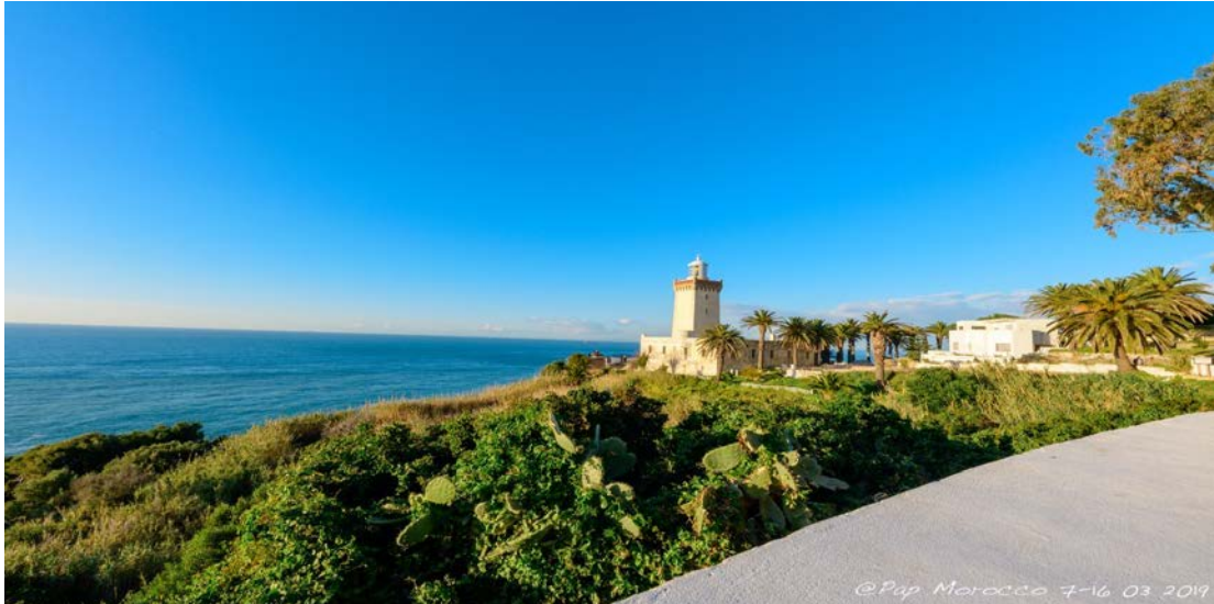
Morocco 7-16 03 2019

ตามตำนานเล่าว่า เป็นเพราะเทพเฮอรัคิวลีส ที่ต้องการเดินทางผ่านไปยังสุดขอบตะวันตกจึงยกแผ่นหินออกทำให้เกิดช่องแคบยิบรอลต์ขึ้น จากนั้นนำชม แกรนด์ ซอคโค (Grand Socco) หรือที่รู้จักกันว่า "บีกัสแควร์" จัตุรัสที่รายล้อมไปด้วยเขตเมืองเก่า หรือย่านเมดินา ซึ่งถูกจัดอันดับให้เป็นหนึ่งในสถานที่ท่องเที่ยวที่ดีที่สุดของเมืองแทนเจียร์ อีกทั้งยังถือว่าเป็นตลาดหลักของเมืองอีกด้วย